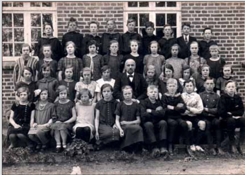
Sådan så konfirmander ud for cirka 100 år siden.

Billedet er fra Lokalhistorisk Arkiv og er fra engang i 1920'erne.