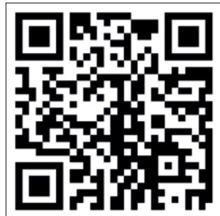
QR-kode til Neighbours