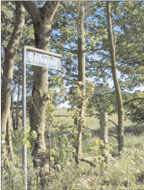
En lokalhistorisk cykeltur i Øster Brønderslev-området

– ad veje der findes i dag til mælkeveje, der var engang