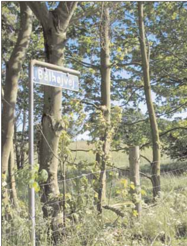
En lokalhistorisk cykeltur i Øster Brønderslev-området

– ad veje der findes i dag til mælkeveje, der var engang